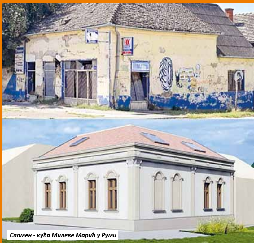
Спомен - кућа Милеве Марић у Руми

Рођена је 19. децембра 1875. године у Тителу, а у Руми је живела од 1877. до 1885. године. У Руми се приводе крају радови на Спомен-кући у којој је живела физичарка и математичарка Милева Марић Ајнштајн. Радови обухватају уређење интеријера и поставку изложби. Кућа у Железничкој улици, број 38, постаће меморијални простор посвећен једној од најзначајнијих жена у науци и биће место где ће се спајати наука, култура и наслеђе.