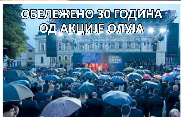
ОБЕЛЕЖЕНО 30 ГОДИНА ОД АКЦИЈЕ ОЛУЈА