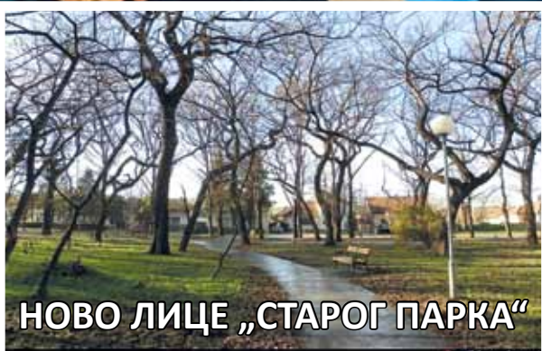
НОВО ЛИЦЕ „СТАРОГ ПАРКА“