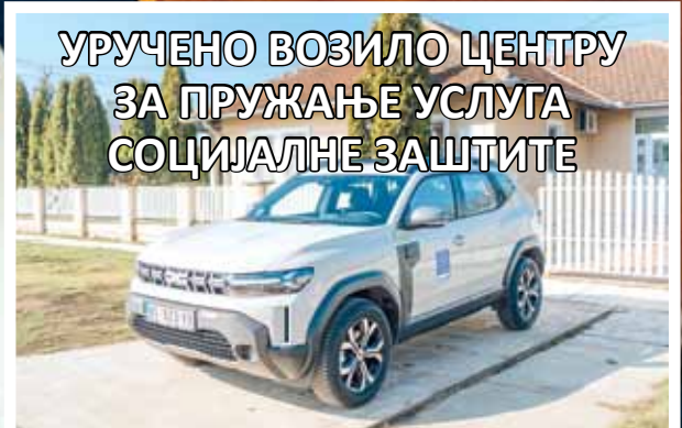
УРУЧЕНО ВОЗИЛО ЦЕНТРУ ЗА ПРУЖАЊЕ УСЛУГА СОЦИЈАЛНЕ ЗАШТИТЕ