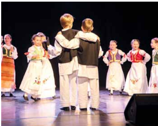
Фото: Љиљана Самац и Весна Зековић М. М.

На концерту је публика уживала у играма из централне Србије, Шумадије, Војводине, Кордуна, Београдске Посавине, Беле Паланке и шопске игре.