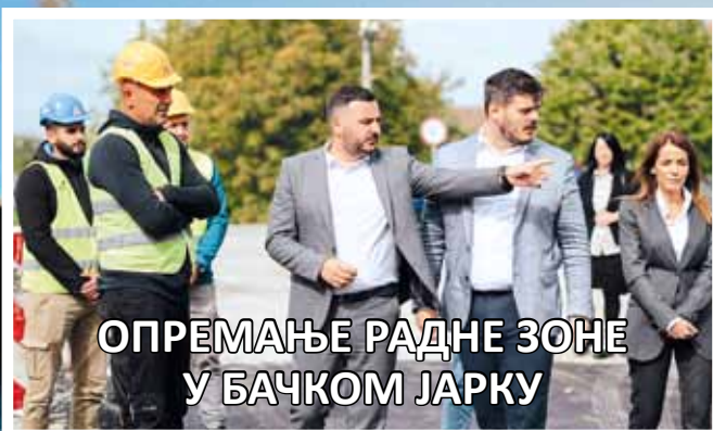
ОПРЕМАЊЕ РАДНЕ ЗОНЕ У БАЧКОМ ЈАРКУ