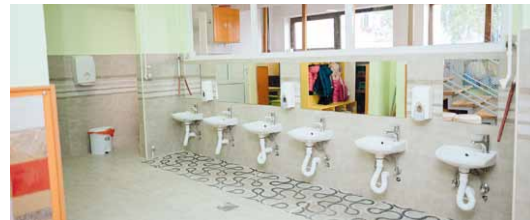
“Ставови изнети у подржаном медијском пројекту нужно не изражавају ставове Општине Темерин, која је доделила средства“.

Реконструкција овог објекта показује да улагање у децу и њихово окружење остаје један од приоритета општине Темерин, која наставља да ствара услове за срећно и безбрижно детињство.