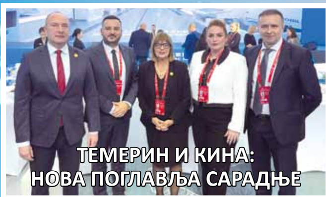
ТЕМЕРИН И КИНА: НОВА ПОГЛАВЉА САРАДЊЕ