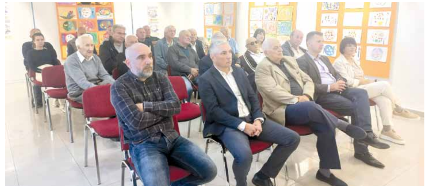
Пројекат «У свему смо заједно 2023» финансијски је подржала Општина Темерин. Ставови изнети у пројекту, међутим, не изражавају нужне ставове Општине Темерин.