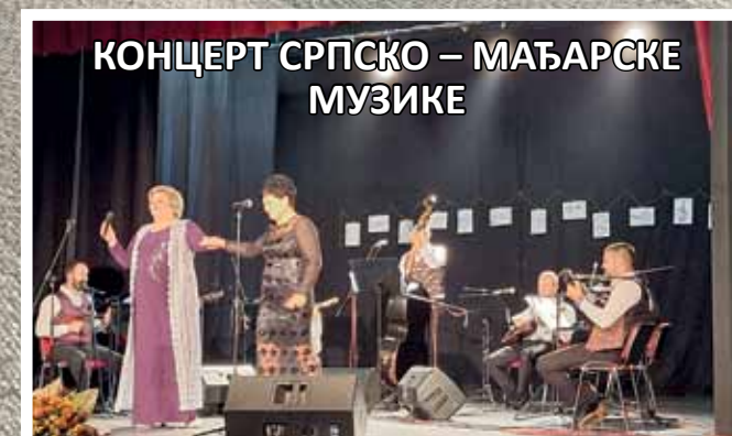
КОНЦЕРТ СРПСКО – МАЂАРСКЕ МУЗИКЕ