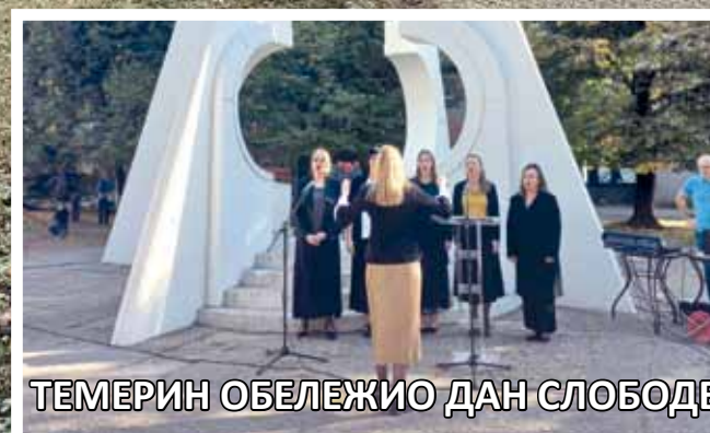
ТЕМЕРИН ОБЕЛЕЖИО ДАН СЛОБОДЕ