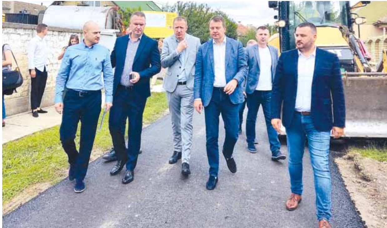
У току радови на асфалтирању улица у Првој МЗ Темерин