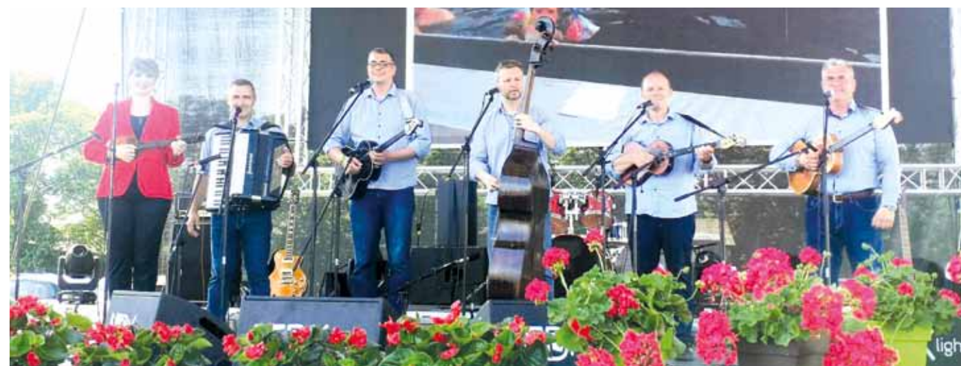
Пројекат «У свему смо заједно 2023» финансијски је подржала Општина Темерин. Ставови изнети у пројекту, међутим, не изражавају нужне ставове Општине Темерин.