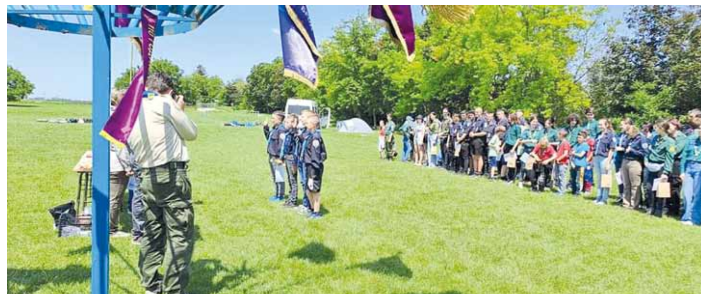
Пројекат «У свему смо заједно 2023» финансијски је подржала Општина Темерин. Ставови изнети у пројекту, међутим, не изражавају нужно ставове Општине Темерин.