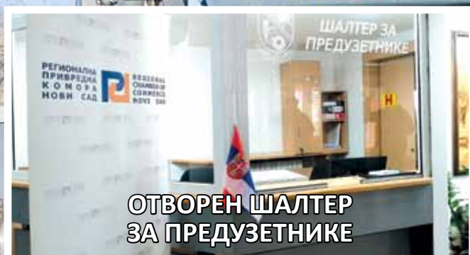
ОТВОРЕН ШАЛТЕР ЗА ПРЕДУЗЕТНИКЕ