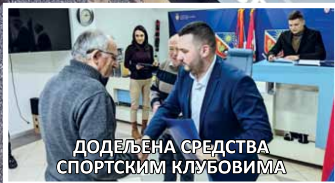
ДОДЕЉЕНА СРЕДСТВА СПОРТСКИМ КЛУБОВИМА