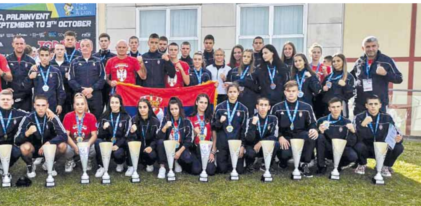
Пројекат „У свему смо заједно“ финансијски је подржала Општина Темерин. Ставови изнети у пројекту, међутим, не изражавају нужно ставове Општине Темерин.