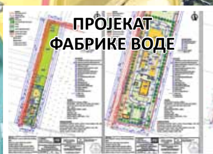
ПРОЈЕКАТ ФАБРИКЕ ВОДЕ

ЗМАЈ ЈОВИНА УЛИЦА ПОТПУНО РЕКОНСТРУИСАНА