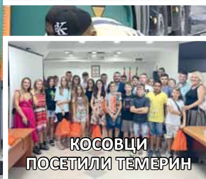
КОСОВЦИ ПОСЕТИЛИ ТЕМЕРИН