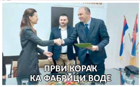
ПРВИ КОРАК КА ФАБРИЦИ ВОДЕ