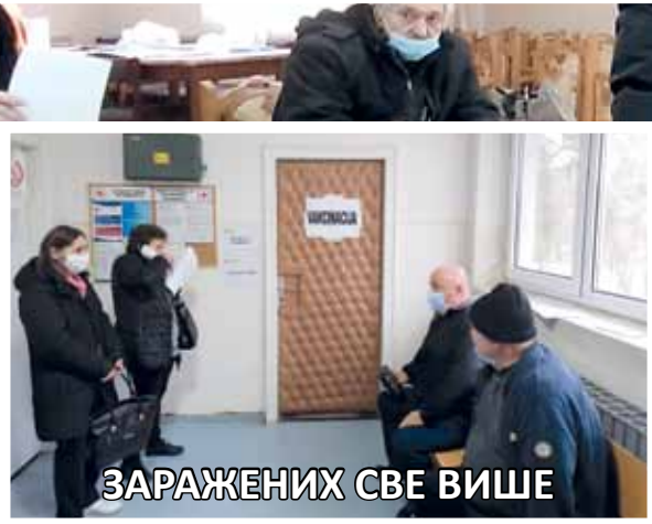
ЗАРАЖЕНИХ СВЕ ВИШЕ