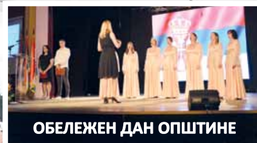
ОБЕЛЕЖЕН ДАН ОПШТИНЕ