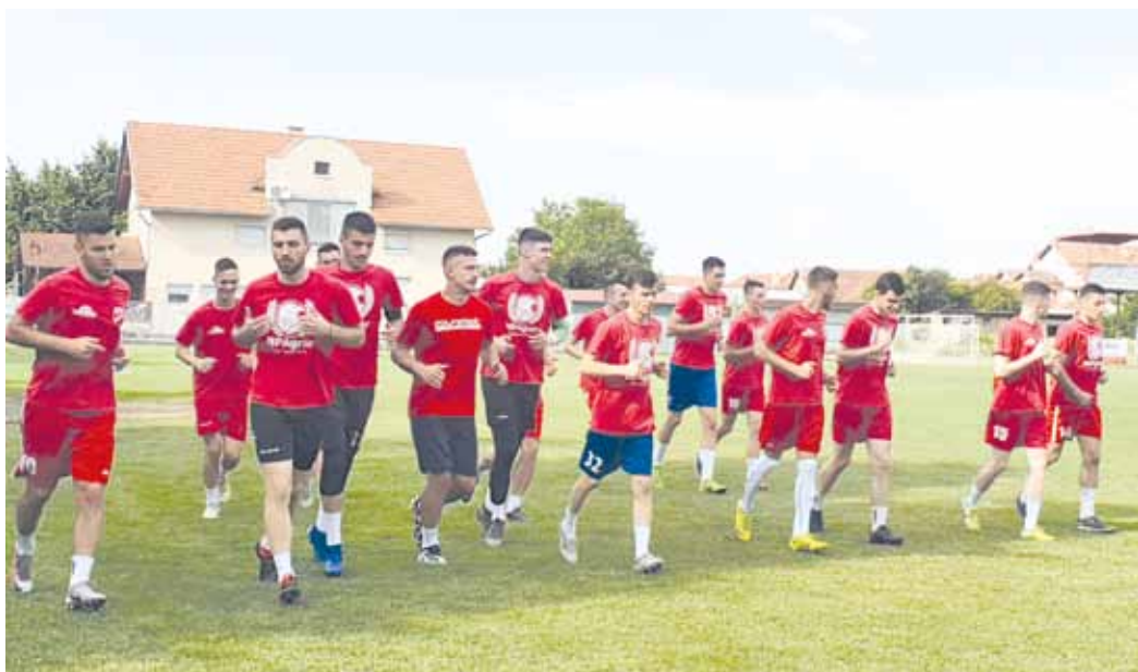
УДАРНИЧКИ ОД СТАРТА: Играчи Слоге на првом тренингу

- У сваком прелазном року, неминовно је да наступе промене у кадру. Код појединих играча је дошло до засићења, било их је и са малом минутажом, док је договор са некадашњим интернационалцем Предрагом Мијићем подразумевао да после шест месеци може да иде, ако му се укаже друга