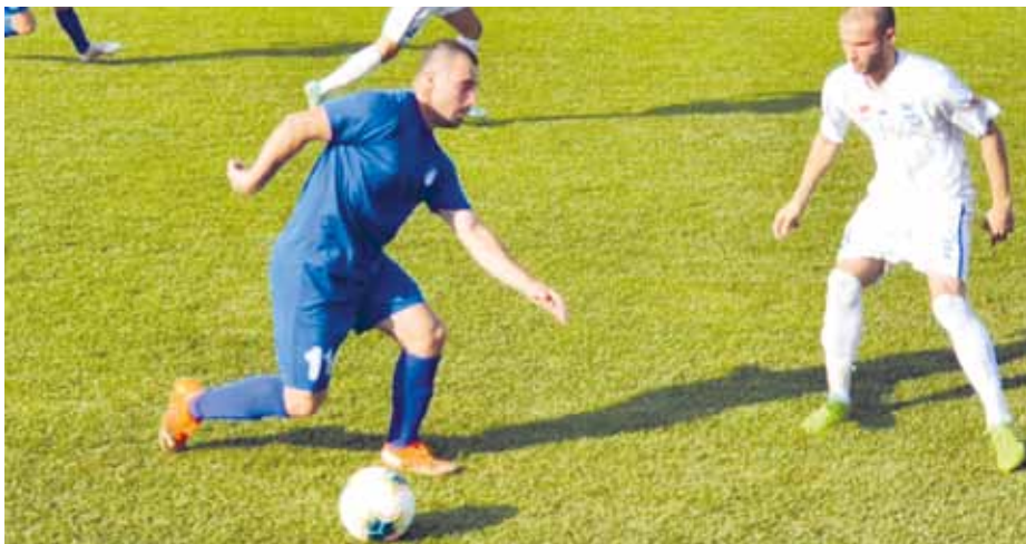
БОДОВИ ГОСТИМА: Папак (Младост) и Бјелобрк (Подунавац)

Млада екипа домаћина, најбољу шансу да се врати у резултатски егал, имала је у 26.