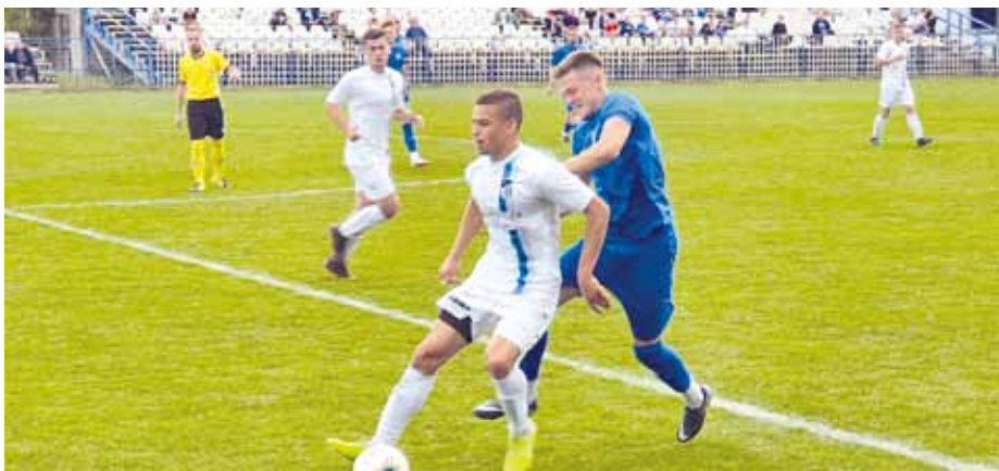
БОДОВИ НОВОСАЂАНИМА: Самарџић (Индекс) и Стојановић (Младост)

Само што је почео други део, штопер Момчило Вуковић је послао дубинску лопту, прелетела је Мирка Дринића и пала испред Кристофера Нађа. Први покушај