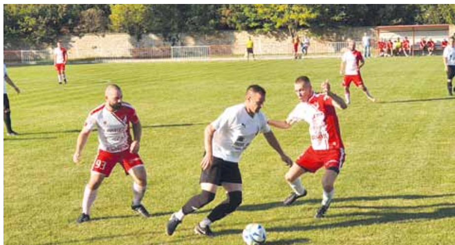
НА РАВНЕ ЧАСТИ: Котуљач (Шајкаш 1908), Јушковић и Шмит (ТСК)