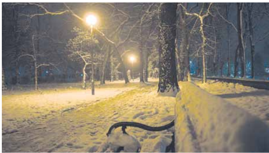
Драган Гуглета: Велики парк